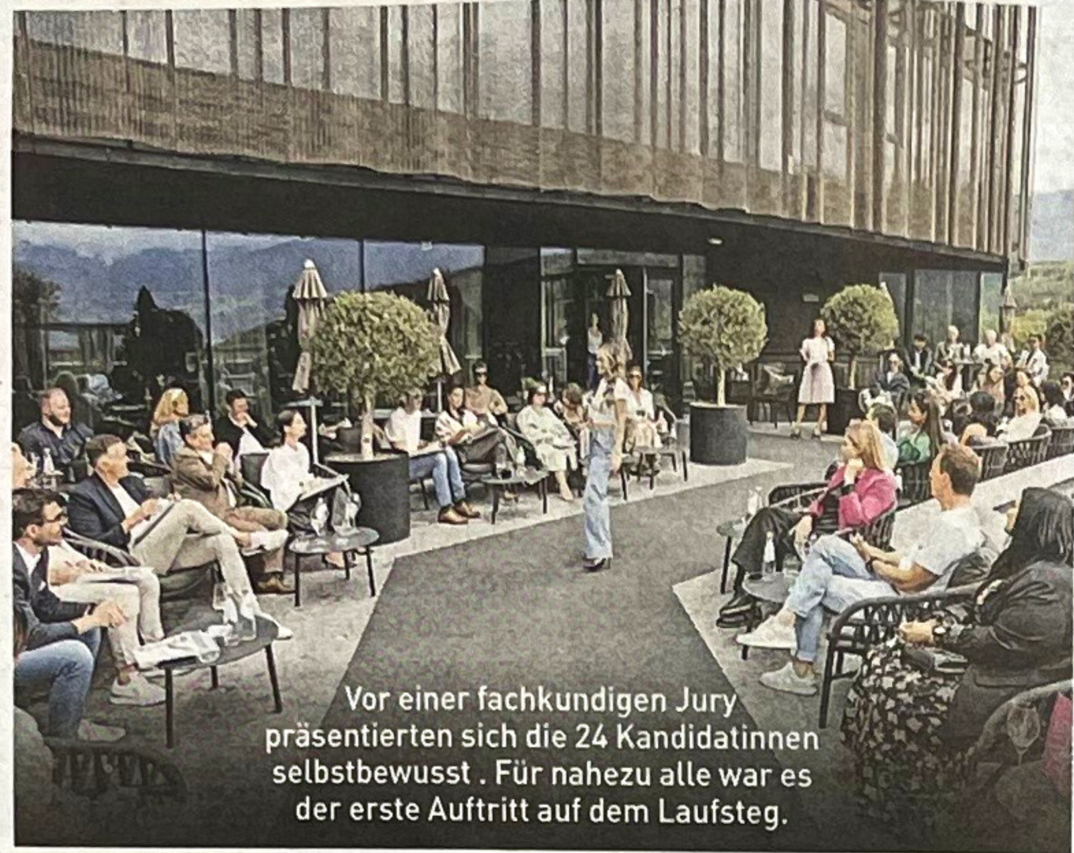
Vor einer fachkundigen Jury präsentierten sich die 24 Kandidatinnen selbstbewusst. Für nahezu alle war es der erste Auftritt auf dem Laufsteg.

Systeme, Innerhofer, Selectra, K&H Living, Top Auto und das Restaurant Tower Garden. Für das gestrige Miss-Casting bot die durchgestylte Dachterrasse des Restaurants bei viel Sonnenschein und warmen Temperaturen den perfekten Rahmen. Gäste und Misswahl-Partner genossen das spannende Event bei toller Musik von DJ Patex, leckeren Drinks und Fingerfood von Küchenchef Alex Pfattner.