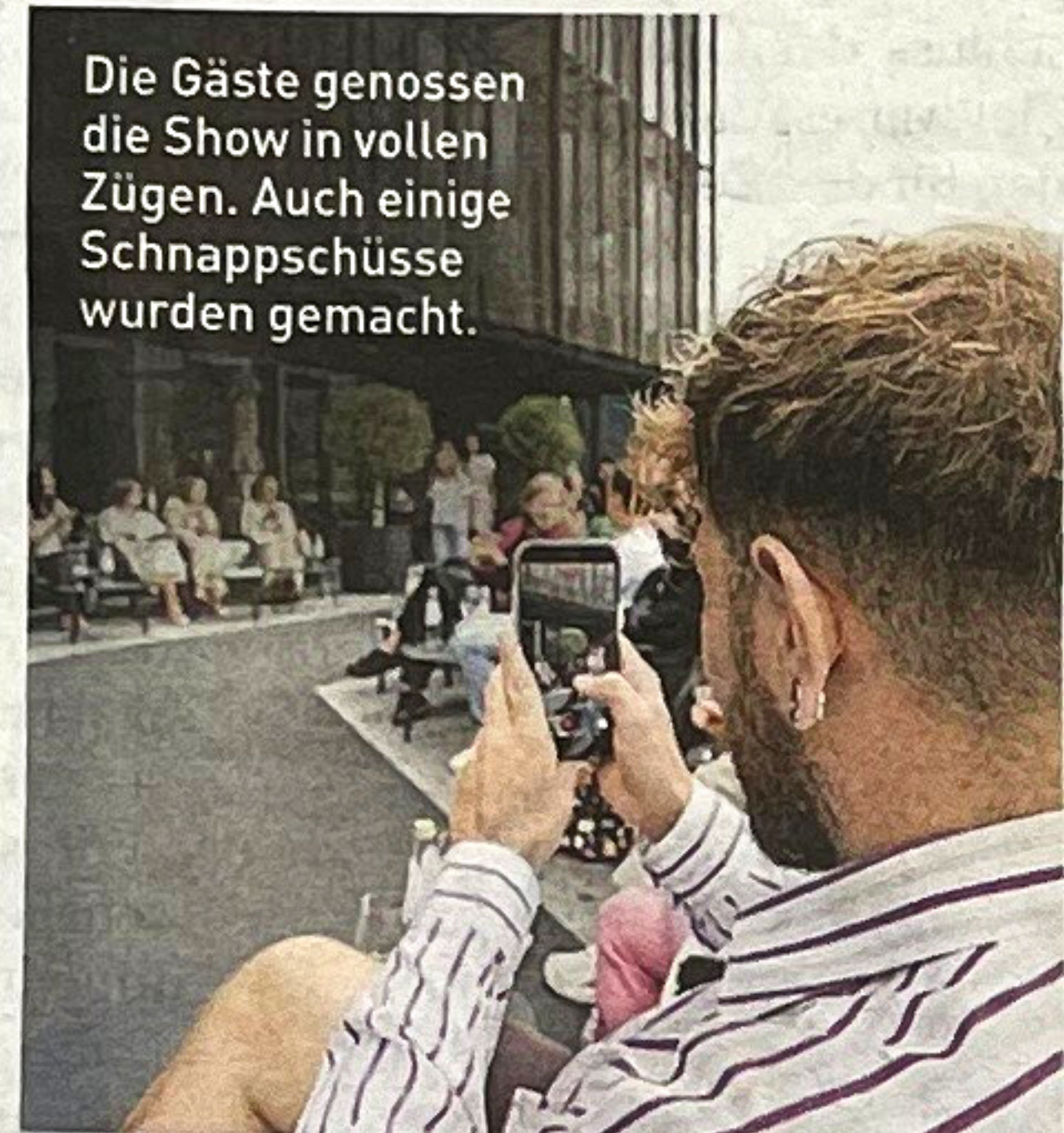
Die Gäste genossen die Show in vollen Zügen. Auch einige Schnappschüsse wurden gemacht.