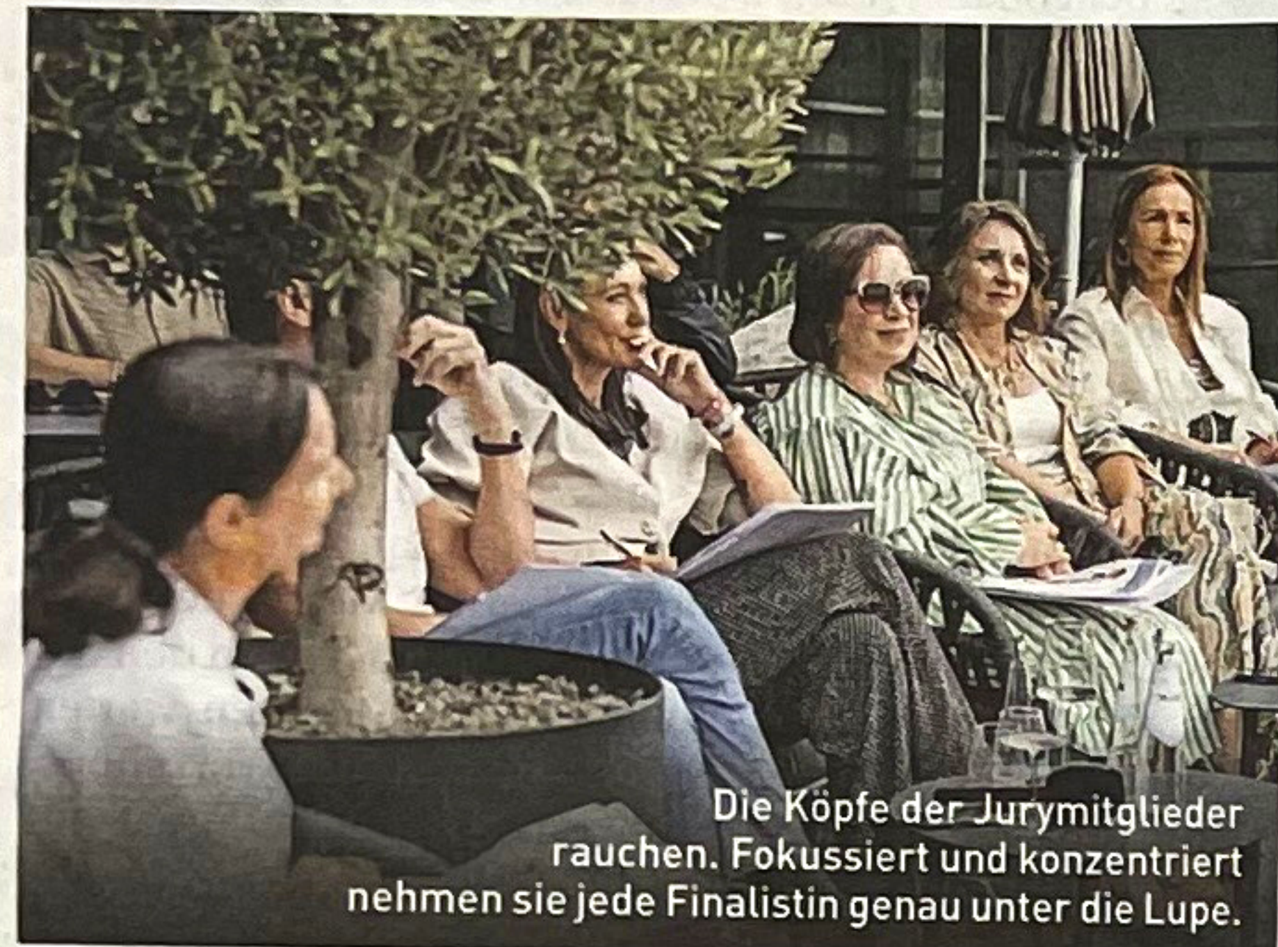
Die Köpfe der Jurymitglieder rauchen. Fokussiert und konzentriert nehmen sie jede Finalistin genau unter die Lupe.